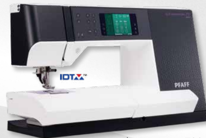
quilt expression™ 720