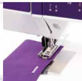
Knopflöcher schnell und präzise genäht mit der PFAFF® Knopfloch-Sensormatik.

Garantiert professionelle Knopflöcher auf jedem Stoff. Geben Sie einfach die Länge des Knopfloches ein. Die expression™ Nähmaschinen speichern diese und nähen das Knopfloch immer wieder in der gleichen Länge und Qualität.