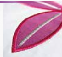
Tapering für mehr Variation beim Nähen.

Tapering – Mit allen 9-mm dekorativen Zierstichen. Nähen Sie Ihren Stich am Anfang und/oder Ende spitz zulaufend. Der Winkel der auslaufenden Stiche kann darüber hinaus noch verändert werden, für einen individuellen Look.